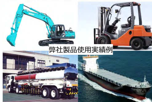
弊社製品使用実績例